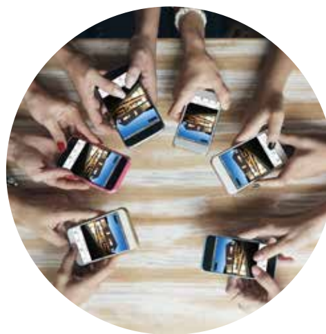
Tutte le app associate al medesimo account sincronizzano la configurazione automaticamente