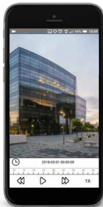
Connessione 4G (qualità alta)