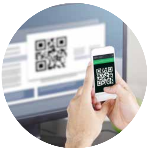
Apprendimento DVR/NVR tramite QR Code

finale. Un aspetto fondamentale è la piena proprietà di EL.MO. del server P2P : ciò si traduce in totale controllo di questa funzionalità, non solo in termini di sicurezza ma anche di continuità del servizio , per garantire ai propri clienti una sicurezza di alto profilo, senza compromessi.