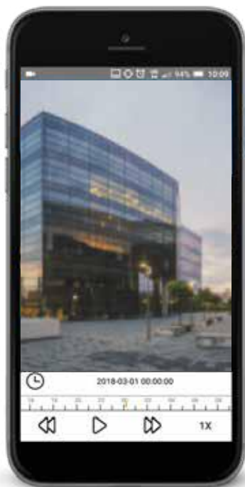
Connessione 3G (qualità media)

quel momento: 3G, 4G o Wi-Fi, ottimizzando così il flusso video in funzione della banda disponibile. La condizione migliore si ottiene con una connessione Wi-Fi.