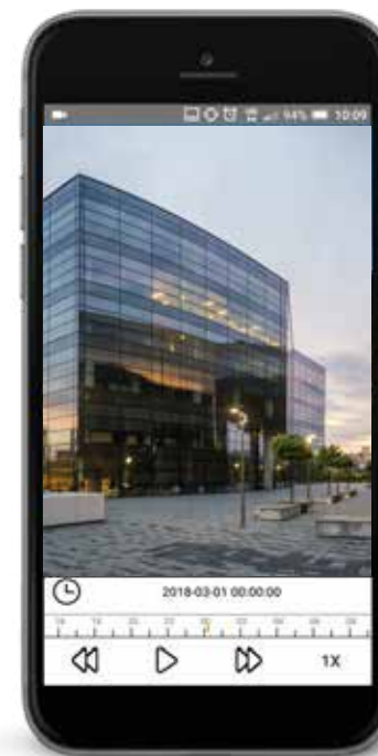
Connessione Wi-Fi ad alte prestazioni (qualità massima)